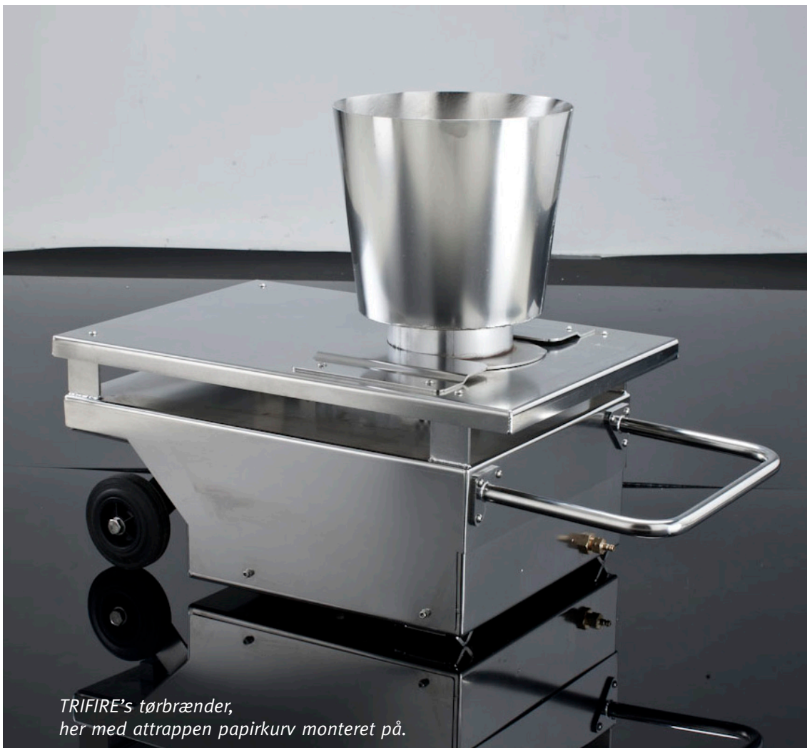
TRIFIRE's tørbrænder, her med attrappen papirkurv monteret på.

TRIFIRE yder 10 års garanti på stel og chassis, på vores brændere.